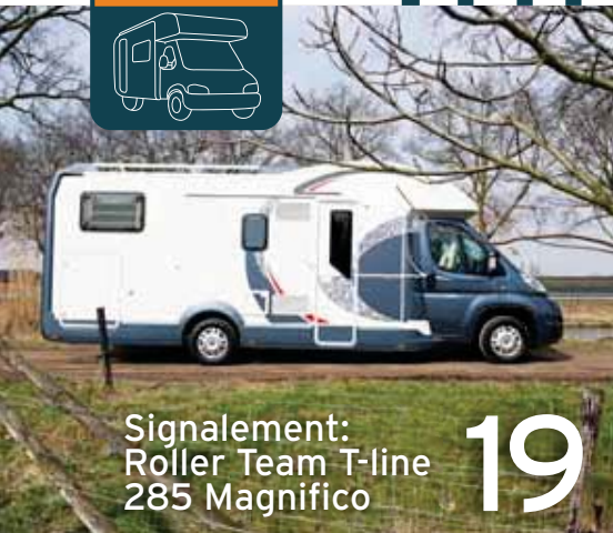
Signalement: Roller Team T-line 285 Magnifico