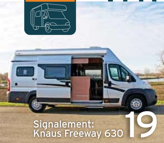
Signalement: Knaus Freeway 630