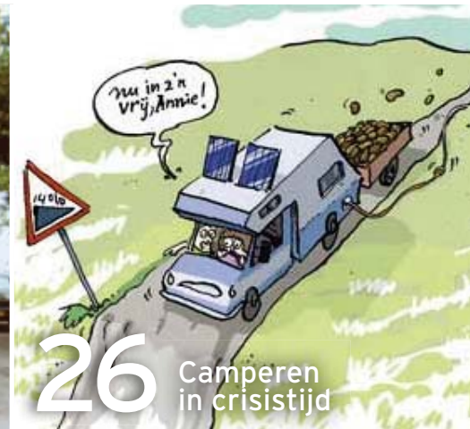
26 Camperen in crisistijd