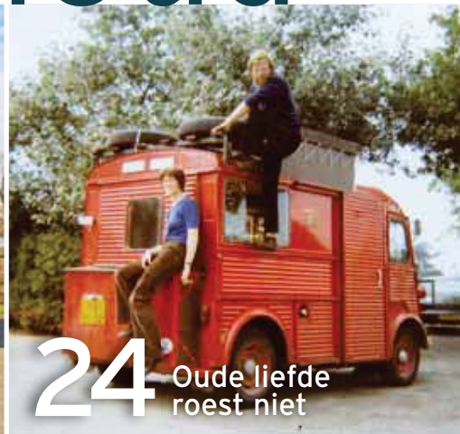
24 Oude liefde roest niet